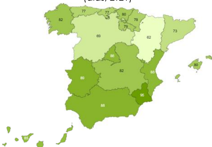
Periodos Medios de Pago por regiones (días, 2T21)